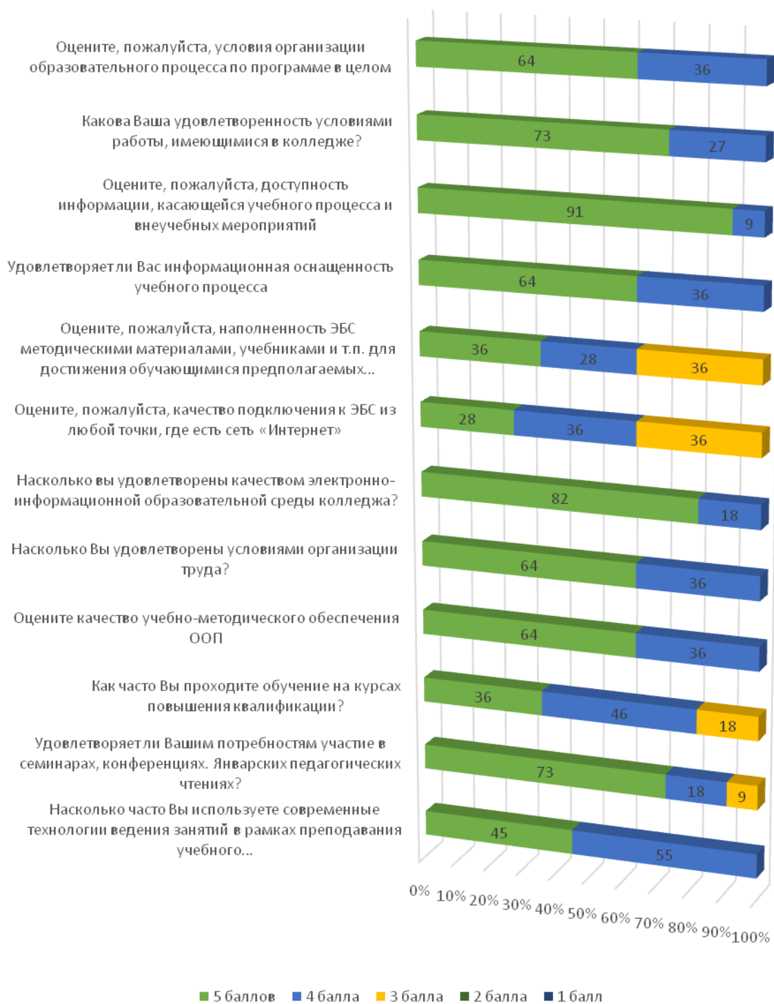
Рис. 1. Результаты опроса педагогических работников об удовлетворенности качеством образовательной деятельности по профессии 43.01.09 Повар, кондитер

В целом, условиями и организацией образовательной деятельности удовлетворены 92% опрошенных педагогических работников. Внутренний мониторинг позволил определить успешность и